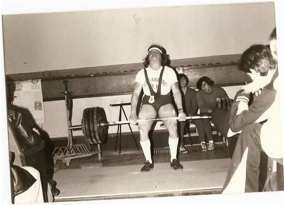
Sopra: 1979 Campionati Italiani Garlasco stacco Kg 220