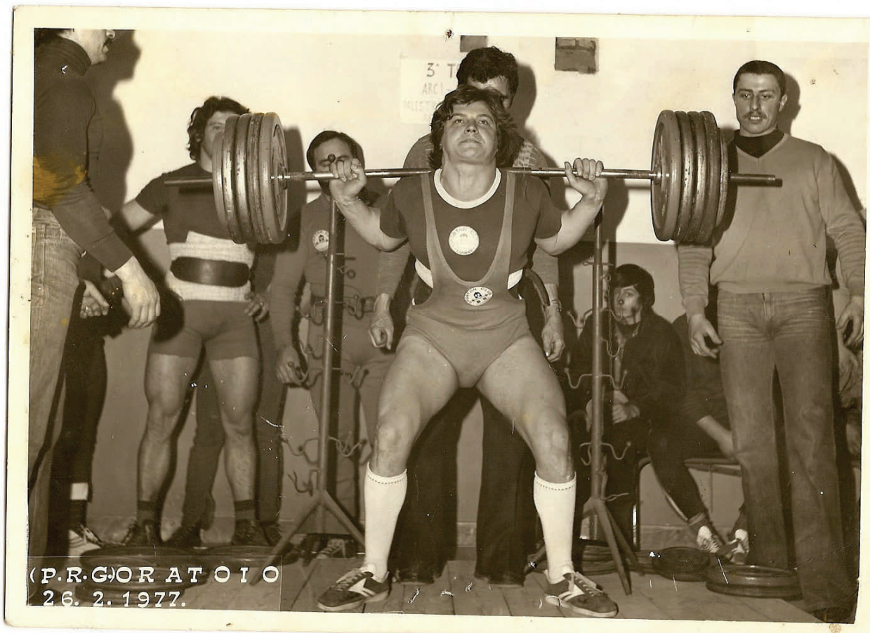
1977 gara promozionale Pisa Squat Kg 190