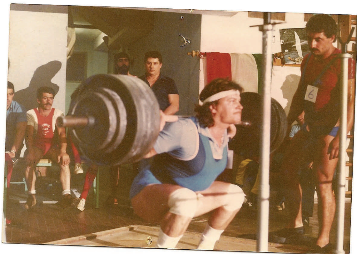
1980 Campionati centro Italia Livorno Squat Kg 235

Vedete "tutto computerizzato e supertecnologico"