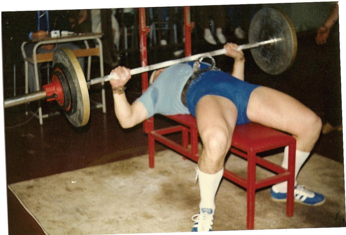
Sotto: 1980 Trofeo città di Livorno panca Kg 155