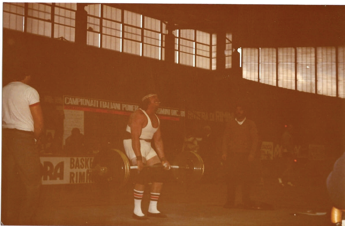
Sopra: 1981 Campionati Italiani Rimini stacco Kg 265