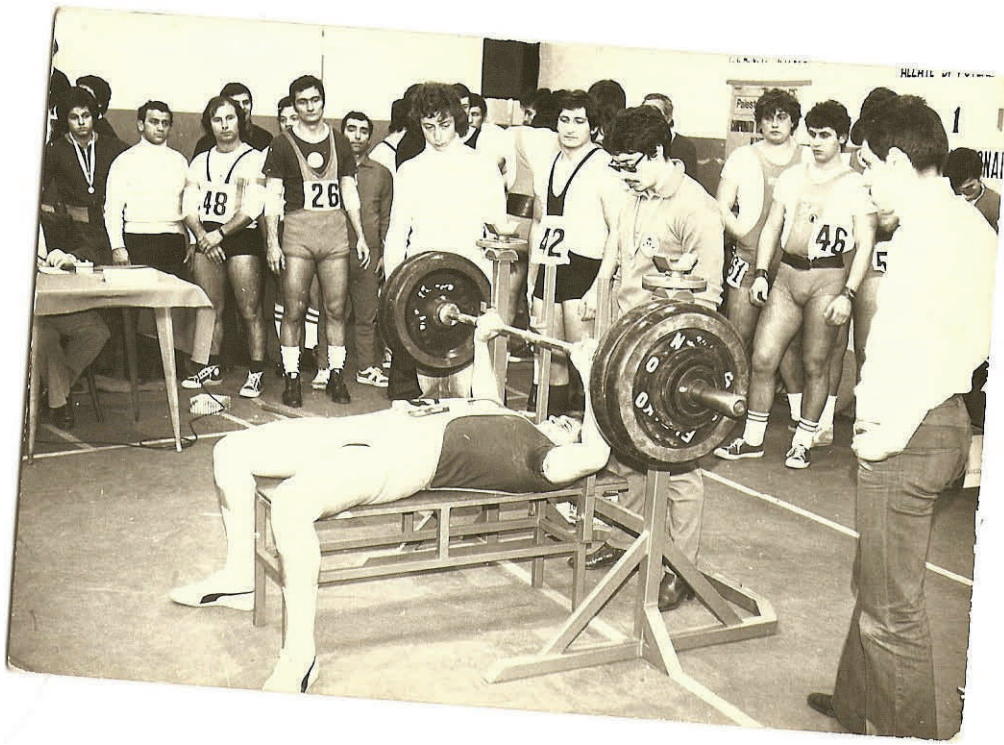
Sopra: 1976 campionati Italiani Borgomanero panca Kg 102,5